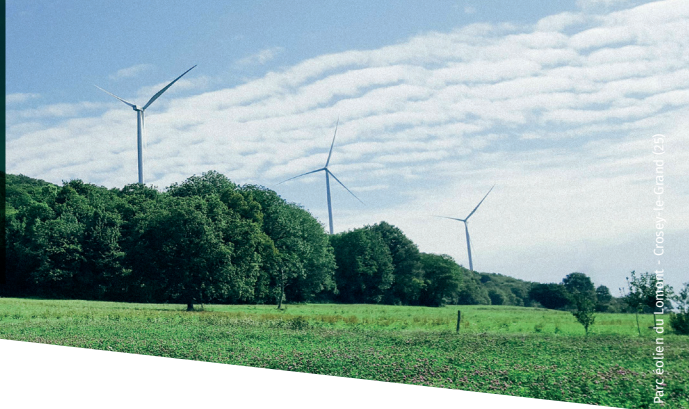
Parc éolien du Commin - Crispin-le-Grand (25)